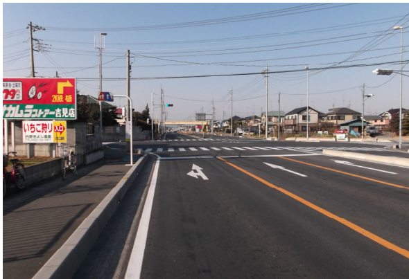
鴻巣市方面からの状況