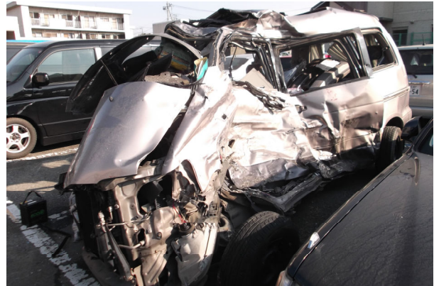
当事者 A 車両の状況