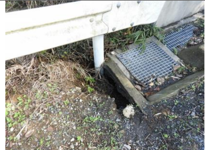
B:盛土下流部道路 調査計画深度=10m