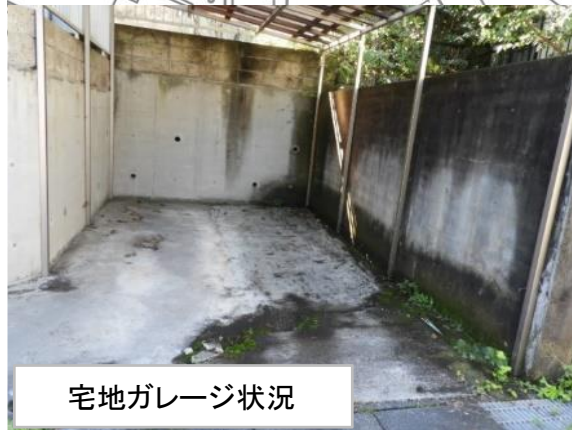
宅地ガレージ状況