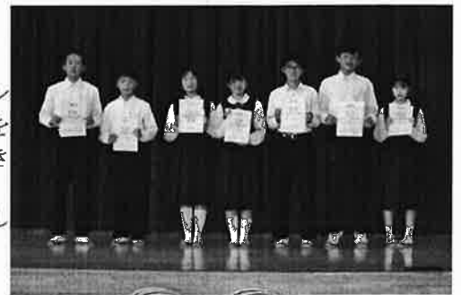
新生徒会本部役員のみなさん