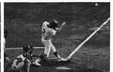
2回戦進出の野球部