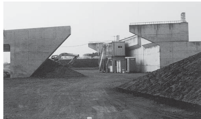
工事が進む仮称新市野川橋

答 県道東松山・鴻巣線の流川区間の整備が進められています。平成23年3月に暫定2車線で開通予定です。