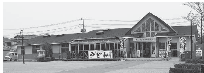
道の駅いちごの里物産館

答 総合振興計画に示されている産業振興の拠点となるよう進めます。維持管理は協定に基づき対応しています。