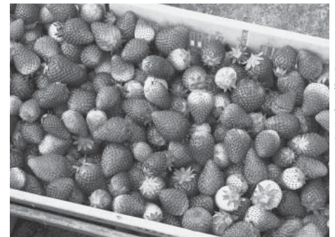
町の特産品のいちご

答 道の駅、J Aの直売所、コスモス祭り等各種イベントの開催にあたり、町内各種農業団体の皆様のご協力をいただき地元農産物や加工品のPRを実施、消費拡大に努めてまいります。地場産の給食食材は今年度14品目、今後も関係機関と連携を図り、地元食材の利用の推進を図ってまいります。