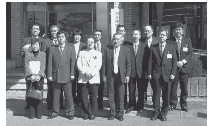
長野県松川町役場前

最後に、今回の視察研修に当たりご多用の中、多くの資料と懇切丁寧に対応してくださいました長野県飯島町議会並びに松川町議会の関係各位に心から感謝申し上げます。議会運営委員会視察研修の報告とさせていただきます。