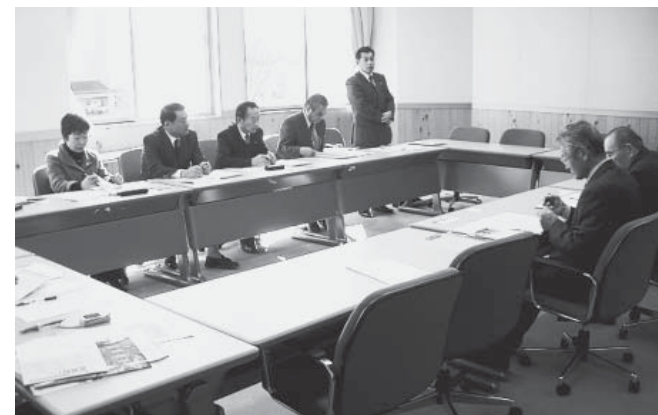
長野県飯島町議会視察の様子

議会運営委員会は、平成21年2月17日、18日に視察研修を実施しましたので、ご報告申し上げます。町民に開かれた議会等、町議会の活性化を検討するため、長野県の飯島町議会と松川町議会を訪問いたしました。