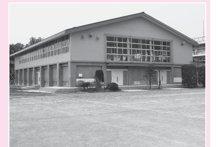
北小学校屋内運動場

上に上がり、現状を確認いたしました。屋上には高架水槽があり、それに付随したパイプ等が配管されていました。同校の旧校舎雨漏り対策には、屋根をかける方法を用いましたが、検討の結果、屋根をかけるのは管理上難しいと思われ、ウレタン防水工事を考えているとの説明がありました。主な質疑として、「ウレタン防水の耐用年数は」との質疑に対し、「11~12年ほどです」との答弁がなされ、「屋根をかけるのが一番良い方法であるので、もう一度、多方面から検討していただきたい」と要望いたしました。1日も早く安全で安心な教育環境を整えるために、本委員会は閉会中の所管事務調査を行ないましたので、ご報告いたします。