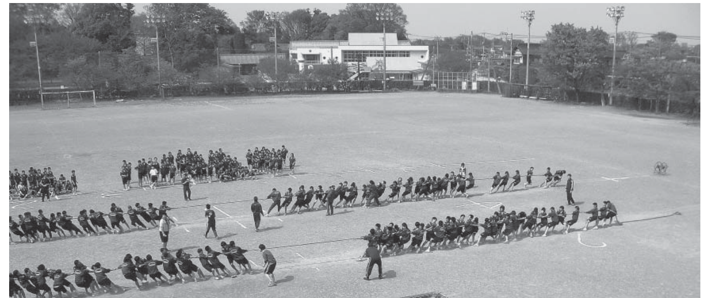
平成21年度整備予定の吉見中学校グラウンド