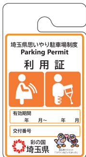
妊産婦、 けが人等用