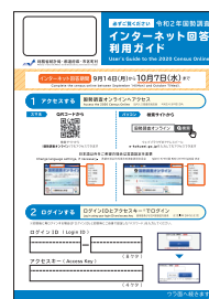
9月中旬にお配りしている調査書類