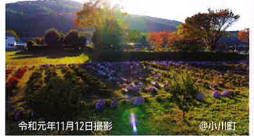
令和元年11月12日撮影