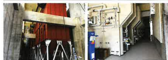
火葬棟建設工事の状況（8月現在）