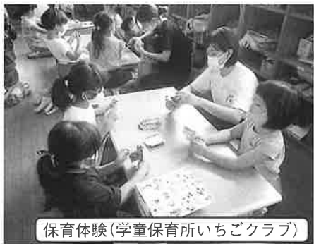
保育体験(学童保育所いちごクラブ)