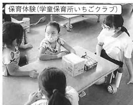
保育体験(学童保育所いちごクラブ)