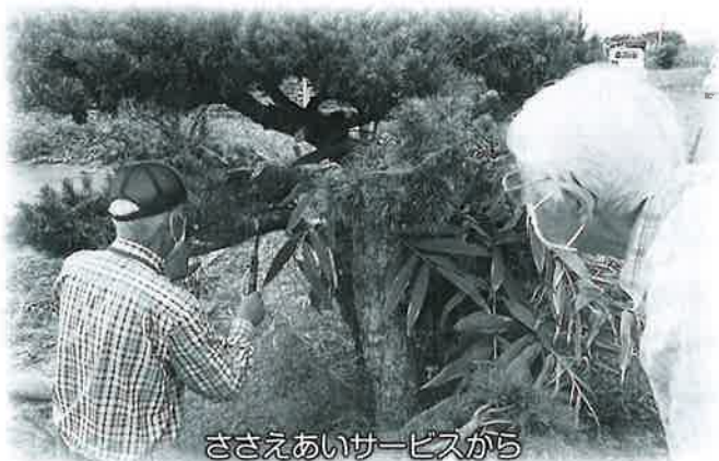
ささえあいサービスから