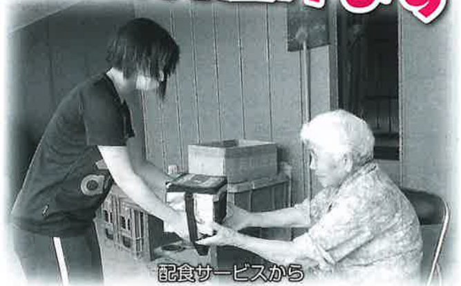
配食サービスから