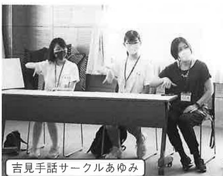
吉見手話サークルあゆみ