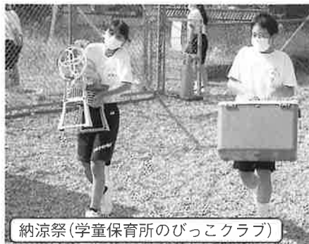
納涼祭(学童保育所のびっこクラブ)