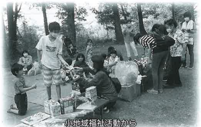
小地域福祉活動から