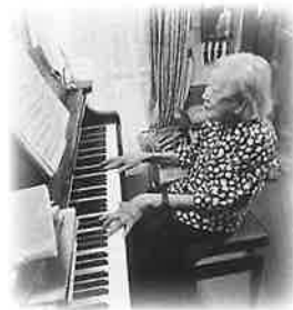
小高様、若い頃はピアノの先生でした。