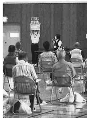
間隔を空けて集まりました。