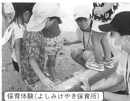
保育体験(よしみけやき保育所)