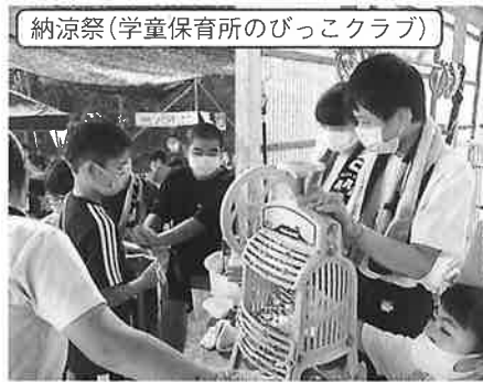
納涼祭(学童保育所のびっこクラブ)