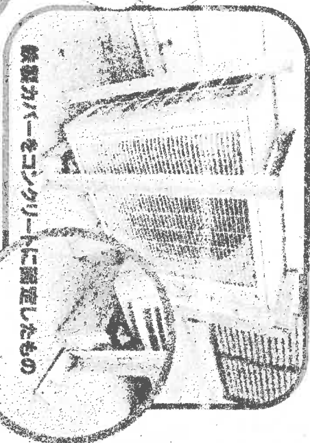
※盗難カバーをコンクリートに固定したものの