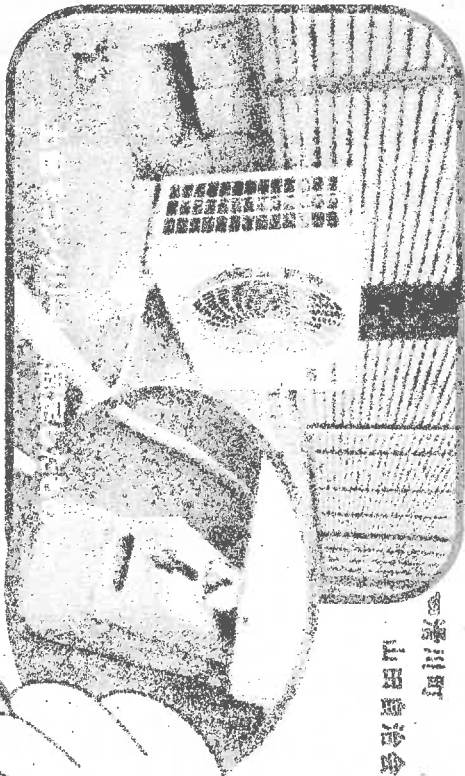
◎清川町 山田自治会