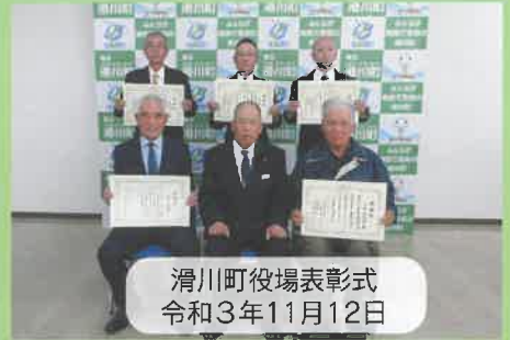
滑川町役場表彰式 令和3年11月12日