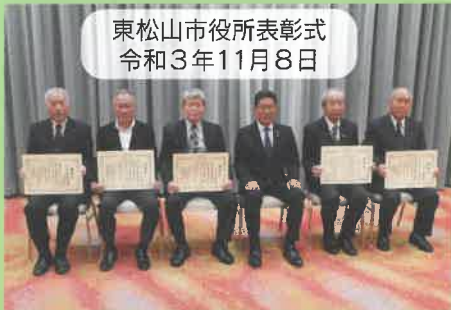
東松山市役所表彰式 令和3年11月8日

毎年秋に行っております地域安全大会・暴力排除推進大会が新型コロナウイルス感染拡大防止のため、昨年に引き続き中止となりました。例年、大会において日頃の防犯活動並びに暴力排除推進活動に積極的に取り組んでいただいている方々に感謝状を、防犯ポスター優秀者には賞状の授与を行っておりますが、今年も市役所、各役場、警察署、学校等に分散して表彰式を行いました。受賞者の皆さま、おめでとうございます。今のところ、感染者数は激減していますが、今後も引き続き感染拡大防止に気を付けながら出来る範囲での地域安全活動をお願いいたします。