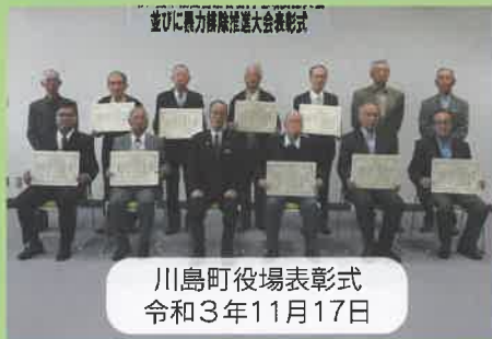
川島町役場表彰式 令和3年11月17日