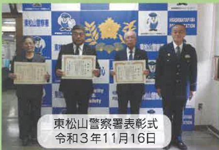
東松山警察署表彰式 令和3年11月16日