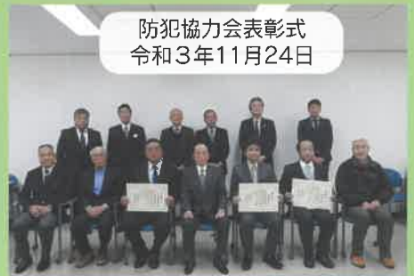
防犯協力会表彰式 令和3年11月24日