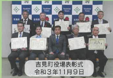
吉見町役場表彰式 令和3年11月9日