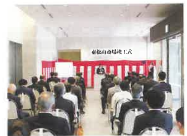
▲竣工式の様子（管理者式辞） ▼感謝状贈呈 （松山町自治会、滑川町第10区）

平成30年度から進めてまいりました東松山斎場施設整備事業は、本年6月30日にすべての工事が完了しました。7月18日には地元自治会長をはじめ、組合議員及び工事関係者等多くのご来賓に列席いただき、竣工式を行いました。昭和57年に供用開始した旧施設の老朽化等に伴い、ほぼ全面的なリニューアルを行い、完成した新たな斎場は、待合ホールの柱にときがわ町産の木材を使用する等、落ち着いた空間を整えました。また、新たに小動物炉を設置し、ペットと暮らす方々のニーズにもお応えできるようになりました。今後とも、故人とのお別れの時間を厳かにお過ごしいただけるよう配慮した管理・運営に取り組んでまいります。