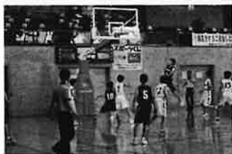
男子バスケットボール