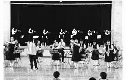
東二小にて、吹奏楽部ミニコンサート