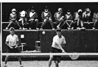
男子ソフトテニス