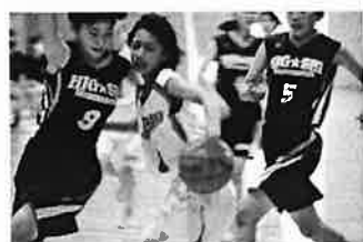
女子バスケットボール