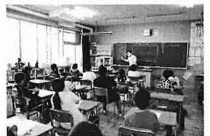
算数の授業を行っている柳教諭