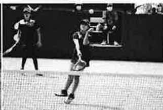
女子ソフトテニス