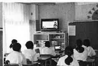
オンラインでの「携帯安全教室」