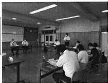
第1回学校運営協議会