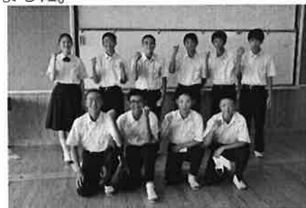
県大会出場選手と吹奏楽部

学校総合体育大会 比企地区予選会を勝ち抜いた選手が、いよいよ県大会に出場します。本校からは、男子卓球部、男子ソフトテニス部、陸上部が出場します。比企地区の代表として、県大会での活躍を期待しています。また、吹奏楽部は、8月5日(金)に埼玉県吹奏楽コンクールに出場します。