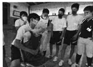
講習会に参加している生徒たち

6月25日(土)比企広域消防本部東松山消防署 吉見分署・吉見消防団のみなさんのご協力で、本校の野球部の生徒・保護者が、救命救急法の体験学習を行いました。私たち教職員は毎年、救命救急法の実習を行っていますが、吉見分署の職員の方から「生徒たちにも学んでほしい」とご提案いただき、代表として野球部の生徒が参加しました。AEDを使用した心肺蘇生法や誤飲への対処等いざというとき、どのように対処したらよいか熱心に学習していました。「広報 よしみ 8月号」に活動の様子が掲載されますので、ぜひご覧ください。