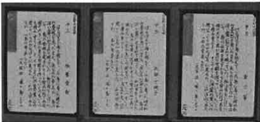
生徒昇降口に展示してあります。