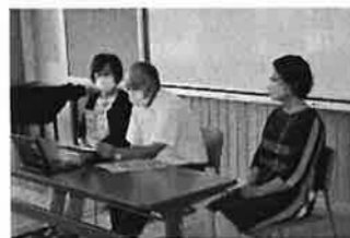
人権擁護委員のみなさん

7月4日(月)定期テスト後に、「携帯安全教室」と町の人権擁護委員の方々からの講話を実施致しました。携帯安全教室では、NTTドコモの方からオンラインで、安全な携帯電話・スマートフォンの使い方、SNSの危険性等にも触れていただき、改めて携帯電話・スマートフォンの正しい使い方を考える機会となりました。ご家庭でもお子さんと一緒に、ルールをつくったり、安全な使い方について話し合っしてほしいと思います。また、人権擁護委員の方からはいじめや嫌がらせなど他人の人権を侵害する行為をしない。困ったことがあったら積極的に相談してほしい等、町全体で子どもたちを守っていることを知ることができました。