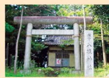
야사카 신사[액막이·풍요기원 등]