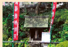
龙性院 [财运、各种技艺等]