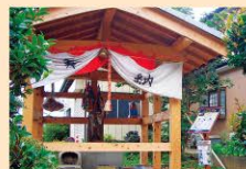
北向地藏 [开运、占卜运势提升等]