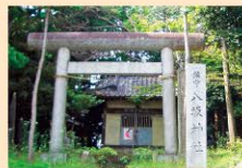
八坂神社 [驱邪、祈愿丰收等]