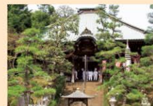
吉见观音 [婚恋、祈愿合格等]