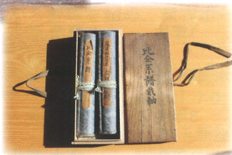
▲比企氏代々の墓と系譜