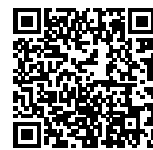
▲省エネ通知のページQRコード