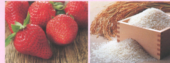
いちご狩りペア券 or 吉見産のお米