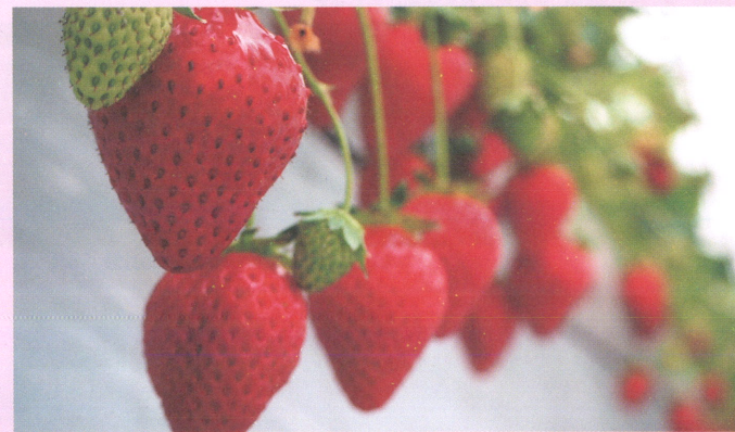
吉見町の特産品である「いちご」↑